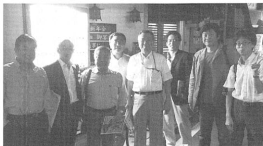
新生「綾瀬支部」の始動に燃える役員の方々

映画『フラガール』や、三谷幸喜一連作品、スタジオジブリ最新作『思い出のマーニー』、海外作品に至ってはキアヌリーブスにも信頼されている世界的美術監督の種田陽平氏(高30回)の講演を、是非とも実現したいと思えます。