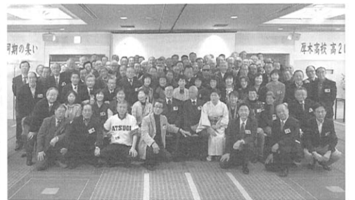
109名もの参加で盛り上がった高20回の同窓会

一先生の俳句集、同期の山下(旧姓小島)知津子さんが発行された句集「麟」と手紙などを飾った。また、同期で現役大臣の甘利明君が公務多忙の中、駆け付けてスピーチをしてくれた。