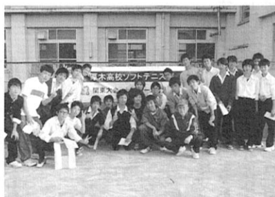
後輩への面倒見のよさはピカ一だった

今年も、予選会の時期が迫つてきた。私は母校のコーチは退いてしまったが、我々を見守つてくれているあの墓前に今年も結果に係わらず報告に行くつもりだ。だが、あの愛情いっばいの声が返つてこないのはさみしい。でもきつとらんみりしてたら、愛情たつぷりに「だめじゃんか」と、あの声が聞こえてくるような気がする。