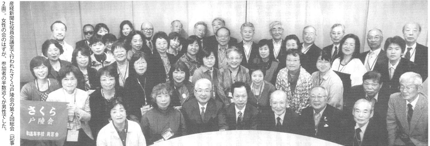
産経新聞社役員会議室で行われたさくら戸陵会の第2回総会(記事2面)。女性の会のはずが、参加者の半数近くが男性でした。