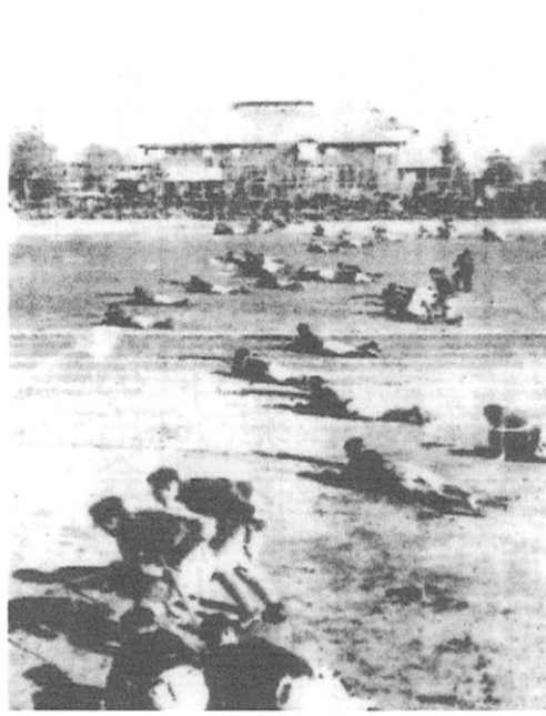
運動会の華、5年生全員による模擬戦

ち上げ、会長は元全日長の麻生氏(中34回)が就任したが、先般解散した。4年生の時の関西旅行は従来往復とも汽車であったが、2、3年前から横浜、神戸まで大阪商船の南米航路の客船に乗船、チョッピリ洋行気分を味わわせてくれた。この船旅で、2期上の生徒がいたずら半分「我、遭難す、太平洋の藻屑と消えんとす。〇〇丸」なる紙切れをビール瓶の中に入れて流した所、静岡の漁船に拾われ、すわ大変と、捜索船が出動、大騒ぎとなったが、その後本船は無事神戸に着いている事が分かり一件落着、今ではとても考えられない。終戦までは日本は完全徴兵制で、男子は20才で徴兵検査を受け軍務に服さねばならなかつた。11月の明治節には毎年の運動会が催された。その日は雨がふらないというジンクスがあつた。運動会の華は5年生全員による模擬戦(写真参照)であつた。武装した1個中隊の5年生が校庭の南から、煙幕の中、鉄条網を破り、空砲を撃って進撃する様は正に実