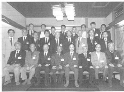
「校歌祭」での「おもてなし」を決議

また役員から「平成27年の『第10回青春かながわ校歌祭』は、幹事校が秦野高校で、秦野市文化会館を会場に開催の予定です」との