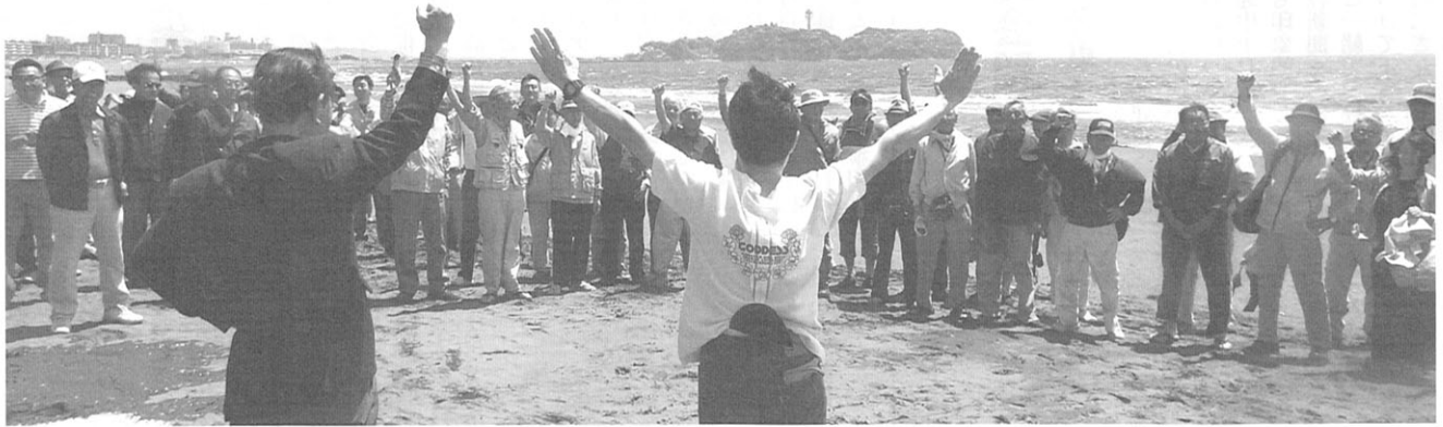
ゴールデンウィーク恒例の「第15回地引綱」が晴天に恵まれた去る5月4日に開催。参加者も子供を含め過去最高の190名以上が集った。締めめの厚高校歌の太鼓囃は、眼前の江ノ島にも届きそうだった。

発行 神奈川県立厚木高等学校同窓会 編集 厚木高等学校同窓会広報委員会 TEL 046 (221) 4078 FAX 046 (222) 8243