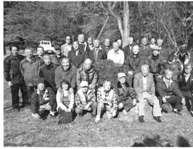
紅葉にも親しめる「憶い出の杜」(25年11月16日)