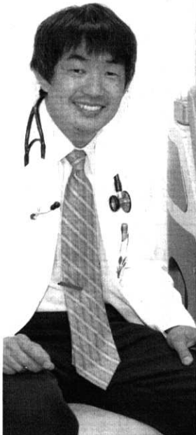
老化予防の「脚本」を書き続ける

研究所で老化のメカニズムを研究。昨年春より実家のある愛甲石田駅前で「南毛利内科・抗加齢人間ドックセンター」を開院しました。「老化」は自然の摂理で抗し難いものという考えは、最新の医学研究の中で変わりつつあります。不死は無理でも120歳の最長寿命まで元気であり続ける方が少しずつ解ってきているのです。方策は1つではなく、いくつもの作戦を習慣的に積み重ねる必要があります。まずは、網羅的な健診・癌検診を定期的に行うこと。更に現在の自分の各臓器がどの程度老化しているのか確認すること(血管・骨・筋肉・脳年齢測定)。その上で5年後の目標を設定し、運動・食習慣・社会環境を修正していく必要があります。