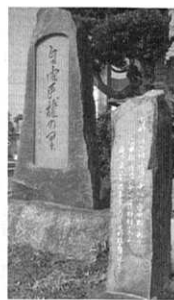
自由民権の里の記念碑