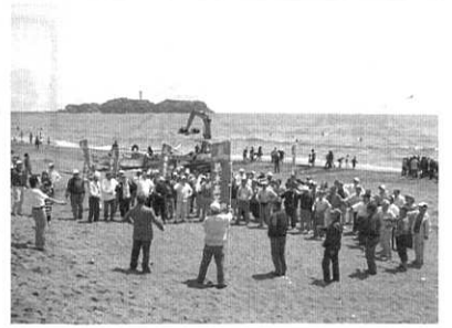
毎回大盛況の「地引き綱大会」(25年5月4日)