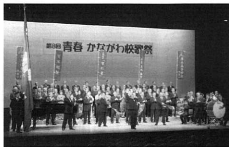
「青春かながわ校歌祭」も今年で第9回

○練習日/8月下旬、厚木高校中庭にて○参加申込/各戸陵会支部取りまとめ○本厚木・横須賀間往復バス予定、夕刻戸陵会主催の交流・懇親会計画あり。