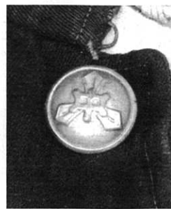
3年前発見時の制服とボタン

健康長寿の方にお会いすると、多くの方が自分の真実に向き合う勇氣を持っています。勇氣を持って診療所にこられた方に愛情を持って真実を伝え、5年後の希望と一緒に見つめる作業は、主演に合った脚本を書くことに似ていると最近、気づきました。