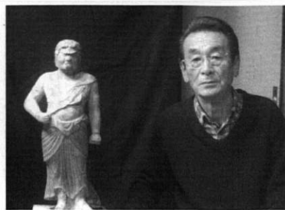
目下、不動明王立像に挑戦中