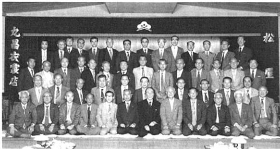
伊勢原戸陵会の前身(白ふろしきに小倉服をなつかしむ会)

平成2年、支部ごとの名称が統一され伊勢原戸陵会となったのち、事務局として数年活動してきました。その間、色々なことを経験して来ましたが、今でも自分を素直に