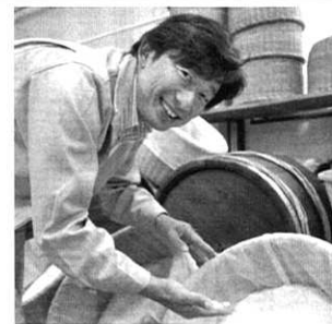
米作りから酒造りまで手がける

私の家は江戸の終わり、安政4年(1857年)から続く酒屋で、私で6代目になります。厚木高校卒業後、大学に進み、大手証券会社を経て、19年前に家業に戻ったとき、酒屋が他所から買った米で酒造りをする事に疑問を持ち、平成7年に米の流通に関する法律が改正されたのを機に、自社での酒米作りを始めました。「酒作りは米作りから」をモットーに地元、神奈川県海老名市で、山田錦・雄町・亀の尾・神力などの酒米の栽培を広げ、今では自社栽培面積4ヘクタール、契約農家を合わせる30ヘクタール余りになりました。これは海老名市の田んぼの1割に当たります。あくまでも米からの一貫生産にこだわるのが、いづみ橋の酒造りです。