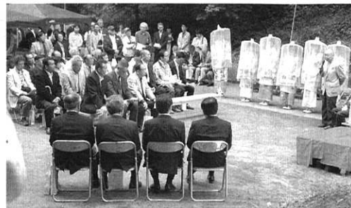
—昨年の「第1回小町まつり」

(化粧池)、③小町井戸(化粧井戸)、④小町竹(業平竹)、⑤小町塚、⑥小町橋(小町の七不思議)、⑦小町海苔、といった「小町の七不思議」として伝承されてきている。そこで、玉川地区の有志が集まって「小野小町研究会」を組織し、伝承話が風化しないようにと小町伝説の遺跡の復元、ならびに保存・伝承活動と小野小町研究活動をしていきます。