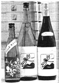
環境保全のシンボル「赤トンボ」

いづみ橋ではシンボルマークに赤トンボを使っています。赤トンボは田んぼで生まれ育つ生き物なので、農薬を減らせば単純にその生息数が増えていきます。大地を借りて作物を作り、それをもとに酒を醸して頂いている企業なので、当然環境保全を常に考える義務があると思っています。酒造業は、産業分類では工場に分けられてしまうのですが、いづみ橋の場合はむしろ農業に近く、農業抜きにしては成り立ちません。酒はいわば農産物加工品です。原材料の確保という意味だけではなく、お酒を通じて、田んぼの多面的な存在価値や、自然との共存を広く訴えかけたいと思っています。また平成18年からは、全てのお酒を「純米」にしました。年々アルコール添加したお酒(人工的に製造したもの)は減らしてはいたものの、全量純米に踏み切るのは、大きな決断でした。元来日本酒は、米と米麴で造ったものという、あるべき論はもちろん頭にあります。栽培に力を注ぐにつれ、大事に造った米を手塩に掛けて醸し、最後にアルコール添加する事に抵抗を感じるようになったのも大きな要因です。酒は食事のよき引き立て役と考え、食事に合う辛口(時には超辛口ですが)の酒質を目指しています。美味しいものを食べて、美味しい酒を呑み、それを共有する仲間がいれば、これに勝る楽しみはないと言っても過言ではないでしょう。