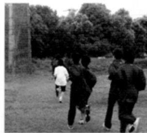
校内ランニングコースの新設に資金協力

戸陵祭は6月の体育部門と9月の文化部門それぞれで、若者の知恵とエネルギーの発散が見られ、