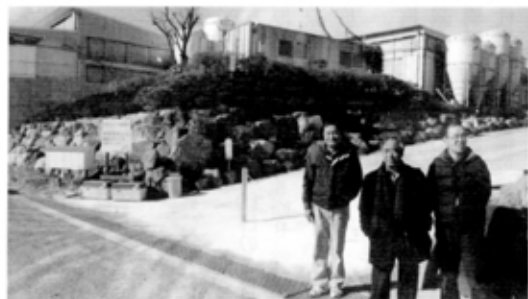
近代的な設備のもと「本物作り」を目指す海老名畜産を訪問

現在までに作り上げた豚舎のシステムは自然界のもつ合理性を信じて作りあげたもので、自然界の力を利用した浄化システムのこと