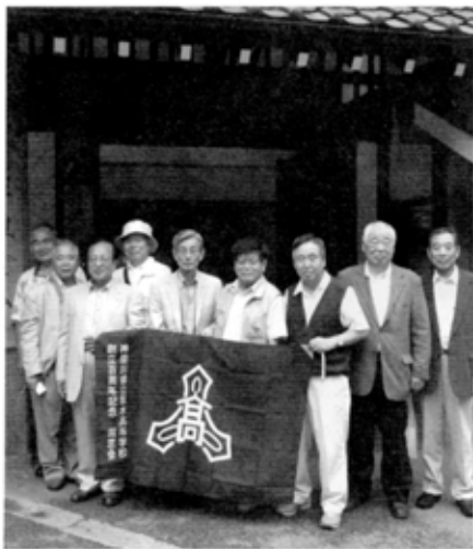
同期会(高9回)のメンバーが佐渡旅行に訪れた

佐渡島へは、同窓生の皆さんもたくさん来ておられることでしょうか。新潟市からはジェットフォイルで一時間、カーフェリーで2時間半の距離です。どこまでも澄んだ海や、トキ