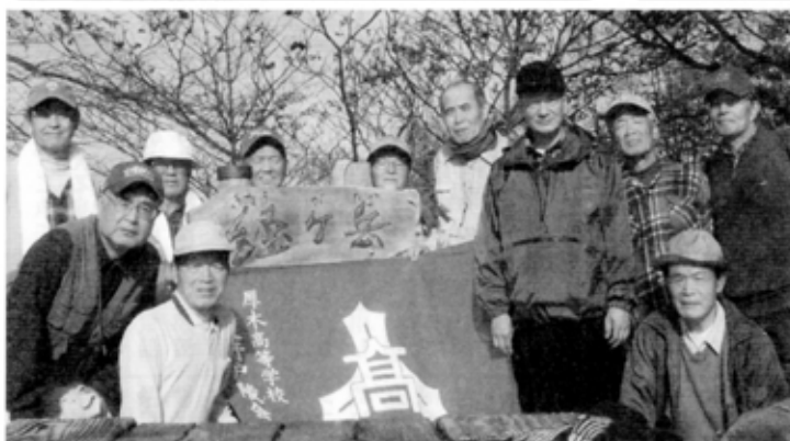
恒例となったハイキング。今回は西山縦走に挑戦

近年は、時折会合などでお会いする程度でしたので、体調を崩された様子は存じ上げませんでした。いつもにこやかに接し、若い時には、蕎麦を愛好しながらダイエツトを心がけたほど健康に留意されたはずなのに、あまりにも早い旅立ちであった。 ここに謹んで飯田孝君のご冥福をお祈り申し上げます。 平成22年8月15日逝去 合掌