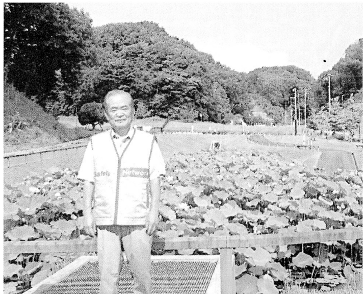
地元のボランティア共に蓮池等の手入れに余念がない

昭和36年、地元の厚木高校に入学後は、自動車部品関係の会社に就職後、40歳前に生活ほでできるがこのまま定年までを過ごしてよいのか非常に悩むことが多くあり、40歳で建築不動産の道に進むことにしました。 人生3回の大きな岐路があるというわけですが、少なからずその1回に入る決断と思います。当然、家族は大反対、父は息子が変わってしまつたと近所に話していたと後で聞きました。 義兄が考えを理解し、父を説得してくれ建築不動産の道に進むことになりました。 今、世間を長時間労働等で騒がせている会社と同じ「行動基本10箇条」を朝礼時読み上げる会社でした。実績最優先であり、社社で「結果を出すまではやり抜け」の姿勢でした。 初めて契約を戴いたのが午前0時だったことを覚えています。