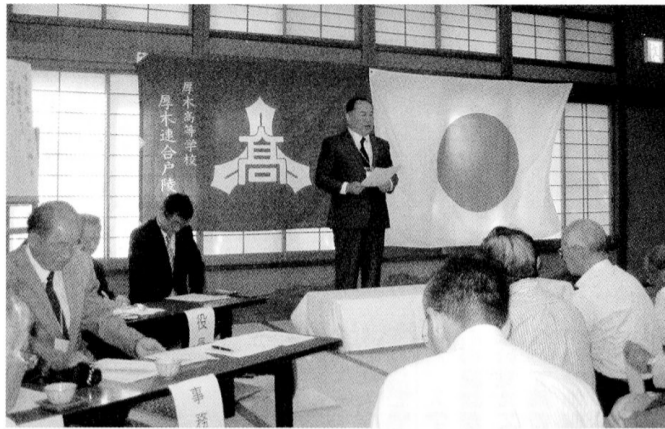
飯山の元湯旅館で開かれた平成29年度通常総会

今「グローバルな人材を育てろ」「マルチな人間を育てろ」と言うことで、生徒は色々なことに一所懸命取り組んでいます。このようなことが出来る厚木高校生をこれからも沢山育てていきたいと思っています。