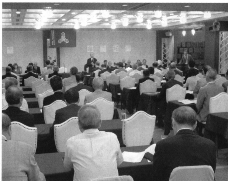
レンプラントホテルで開催された平成28年度通常総会

「軽音楽部」[LOL(ロール)]が5月15日のCute Girls Live 2016(全国大会)で2位入賞。また、6月14日の音楽イベントNAONのNAONでオープニングステージに立つ。「あまつがせ」が7月13日の全国総合文化祭に県代表で参加。「CREALM(クリアリム)」が6月11日、第1回ガールズバンドステーションコンテストで関東大会出場を決める。「新聞部」7月30日から広島県で開催される文化祭の一大イベント「全国高校総合文化祭(総文祭)」に11年連続で出場。「女子ソフトテニス部」6月4日からの関東大会へアパ出場。「弓道部」6月3日からの関東大会女子団体戦に出場。