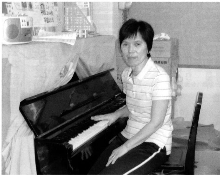
4月から厚木地区私立幼稚園協会会長を務める

その一つは、教員の免許更新制度です。小中学校の免許と同様に、幼稚園教諭免許も10年で更新講習が義務づけられ、更なる質の向上を求められています(保育士免許はこの更新制度はありません)。もう一つは平成27年度に活動しております。とくに教職員研修においては協会独自の研修会の他、県連合会主催や関東地区主催の研修会、更には全国レベルと多種多様な研修に各園とも積極的に教職員を派遣し、教職員の質の向上のために真剣に取り組んでいます。 今、多くの園が創立して半世紀を迎える頃となっており、2代目更には3代目に移行しつつあります。この間大きな法改正もあり、幼児教育の現場も変わりがつづつあります。