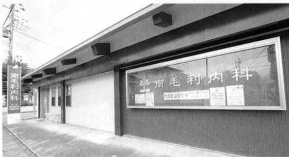
健康長寿に貢献、南毛利内科

最先端のお話なのでどうしても一般では使われない用語も話さなければならぬのですがさすがは厚高の先輩諸氏、好奇心に輝く瞳で聞き入っていたからこそこちらもつい、乗ってしまいました、20分超過してしまいました。日本人の平均寿命は今や八十歳を超えており、この話を聞けば、誰もが何もしなくても自分も八十歳までは元気でいられると考えていると大きな人生の誤算に直面することになります。平均寿命とは、生物として生きていくという事。人間らしく健康に明るく自立して生きていく時間は、十年ほど短いと思われまふ。これが健康寿命。健康寿命を百歳まで伸ばしたい、それが、予防医学、抗加齢医学を