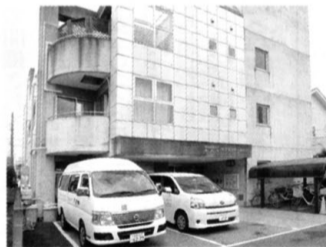
本厚木駅から徒歩5分のケアセンターあさひ

てもらつて、その経験が今でも生きています。大変ありがたい」と回想されていた。 時代が少しずつ動いてきて、現在は少子高齢化が一層進み、ゆとりのある主婦が減少、人手不足の時代。介護等の専門家、コーディネーター、スーパーバイザーも不足する状況。将来を見据えて、次の世代の人が運営しやすくするために、小さな施設を統合する方向で奔走されている毎日、ますますお元気で活躍されている。 広報委員・毛利澄夫(高20回)