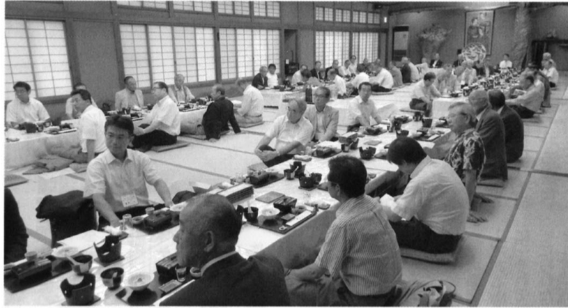
満場一致で議案審議が終了し、開会を待つ懇親会場